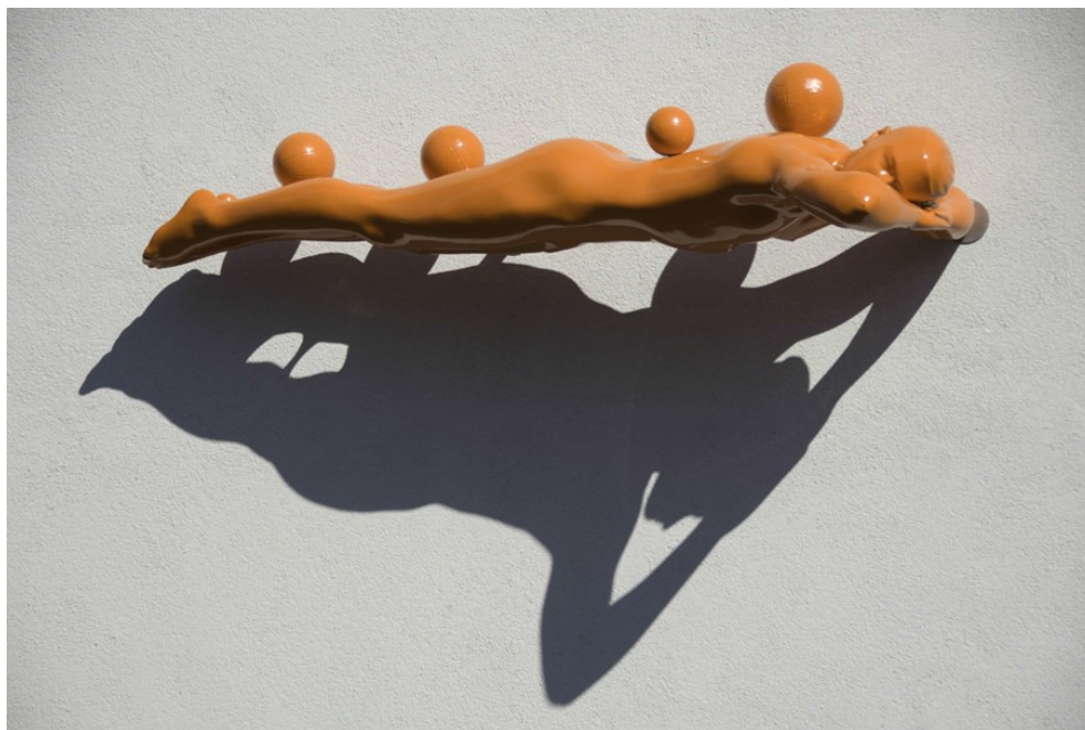
The Play, kunstner Øyvind Nygård, plassering; Bølerhallen

Dokumentene er presentert på www.skok.no